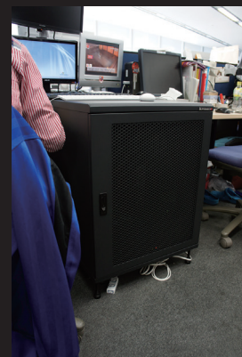
オフィスのデスク周りに設置されたサーバーラック。ラック内にタワー型サーバー、HDD、スイッチ、ケーブルなどが収納されている。