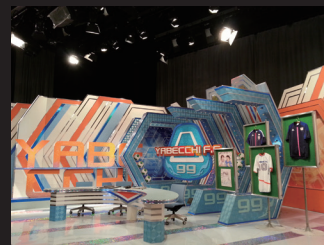
テレビ番組「やべっちF.C.」のスタジオ風景

テックウインドさんからは最新のテクノロジー情報もいただけるので、今後はストレージ容量の拡大、スループットの向上、素材データのインジェストの高速化に重点を置いてシステムを改良していきたいと考えています。