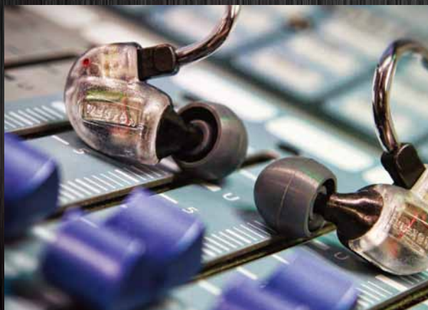
The UM Series